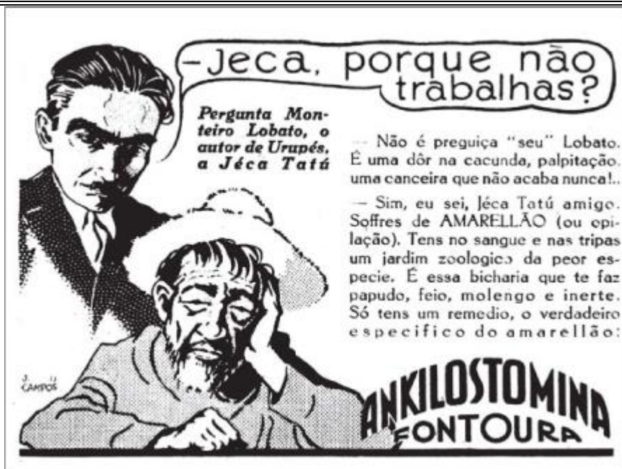
Figura 5 – Almanaque do Biotônico, 1935, p. 4 (ilustração de J. U. Campos).